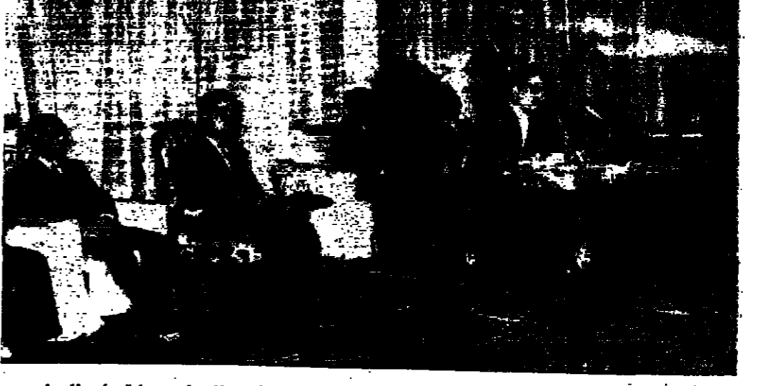
جلالة الملك المعظم يتحدث في الاجتماع ويصف جلالته سمو ولي العهد المعظم ورئيس الوزراء وسيادة رئيس النديوان الملكي وكبار رجال النديوان

مناقشة عملة وجرت بعد ذلك مناقشة عملة ، تحدث فيها عدد من المجتمعين ، الذين عبروا عن ولاء الشعب المخلوق لجلالة الحسين ، والتفاهة حول قيادته الشابة المخلصه . كما أكد المتحدثون وقوف كل أبناء الشعب الأردني التين صفا واحدا مع جيشنا العربي الأردني في مجبهته المسلحة للعدوان الاسرائيلي المجرم ، وصموده في الدفاع عن تراب الوطن وشرف الأمة العربية